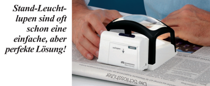
Stand-Leucht-lupen sind oft schon eine einfache, aber perfekte Lösung!

Elektronische Leselupen sind unkompliziert in der Handhabung und können überallhin mitgenommen werden.