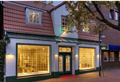
Mitten in Pinneberg: Rübekamp 3, direkt am Drosteiplatz.

In den letzten Jahren hat sich die Rissener Mott Optik Filiale weit über die Elbvororte hinaus zu einer renommierten Adresse für "Vergrößernde Sehhilfen" entwickelt. Da die Nachfrage nach Problemlösungen z.B. bei AMD und Grünem Star auch aus dem Pinneberger Raum immer größer wurde, hat Mott Optik sein traditionsreiches Haupthaus jetzt um diesen beratungsintensiven Kompetenz-Bereich erweitert. Auch hier freuen sich jetzt Beraterinnen mit reichlich Erfahrung, großem Einfühlungsvermögen und ganz viel Geduld auf die vielen Fragen zum Thema Sehhilfen.